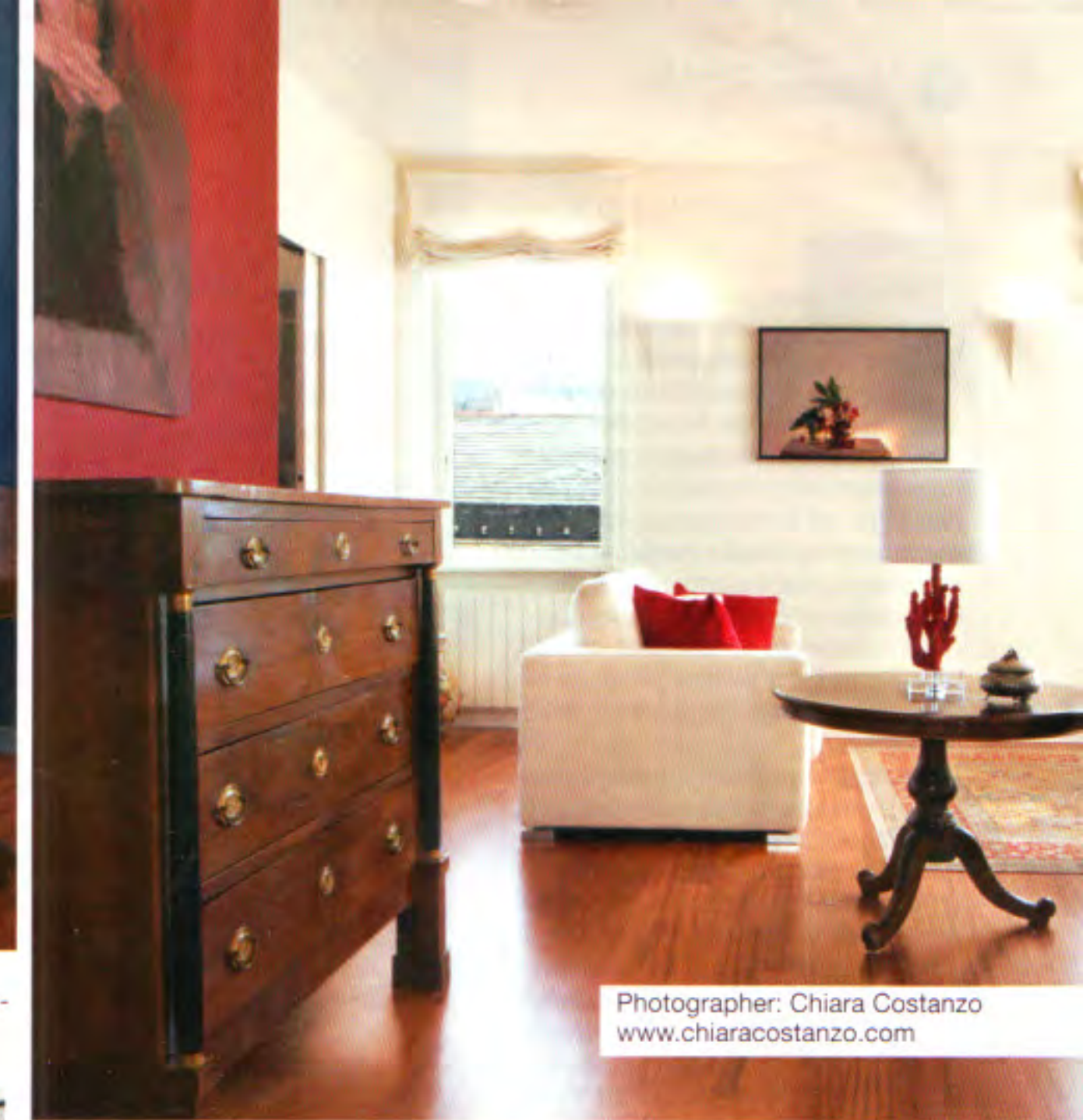
In cucina il tavolo in pietra brasiliana Iron Red. Nella zona giorno tavoli e comò d'epoca abbinati a quadri d'autore contemporanei. Sopra porta divisoria scorrevole a raso muro.